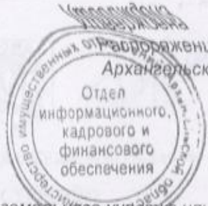
Схема расположения земельного участка или земельных участков на кадастровом плане территории В кадастровом квартале 29:22:060703, расположенных по адресу: Архангельская обл., г. Архангельск, территориальный округ Майская горка, по улице Пермонтова.